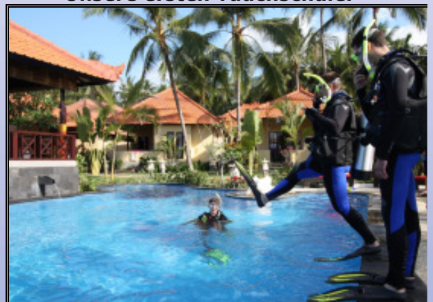
Unsere ersten Tauchschüler

10 Tauchgänge: € 169,- 10 Tauchgänge buchen, 4 Tauchgänge gratis bekommen. Gilt für den gleichen Zeitraum.