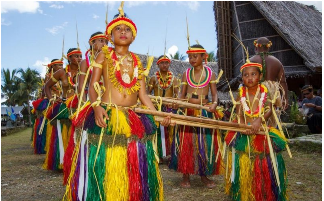
© Brad Holland Manta Ray Bay Resort