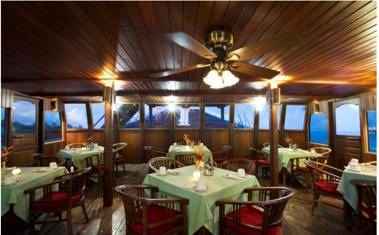
© Brad Holland Manta Ray Bay Resort